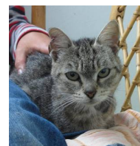
Perrine en convalescence