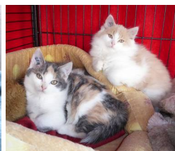
Petrouchka et Pollux