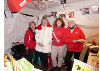
8 déc à Cluny

Et aussi...tant d'autres anecdotes, conseils et actions que nous ne pouvons pas développer ici mais que vous pouvez retrouver sur notre site web chatsducoeurenclunisois.fr et sur FaceBook @ChatsduCoeurenClunisois .