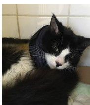
Picasso chez le véto