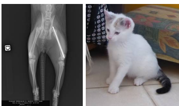
radio post-opératoire de Perlin