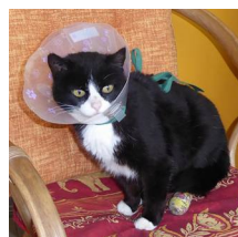
Pupuce avec collerette